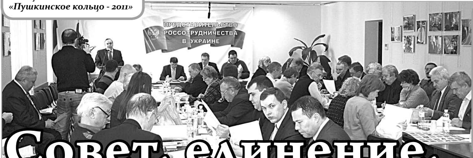
В заседании ВКСОРС приняли участие 50 его членов из 54 утвержденных Всеукраинской Конференцией в ноябре 2010 года, а также почетные гости - представители Посольства Российской Федерации, Россотрудничества, Правительства Москвы и Фонда «Русский мир»

ны, пусть и не без определенных внутренних напряженностей, созданный Всеукраинской Конференцией 2008 года ВКСОРС, наконец-то начав очищать Движение от некоторых «вредных наслоений», объединил 141 легально действующую структуру, из которых 1 имеет статус всеукраинского союза общественных организаций, 11 - всеукраинских, 3 - международных, 12 - крымских республиканских, 2 - межобластные, а также областные и городские общественные организации.