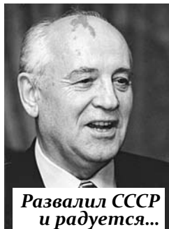
Развалил СССР и радуется...

Участие в нём приняли 5087 человек, из которых 28% «не испытывают нена-